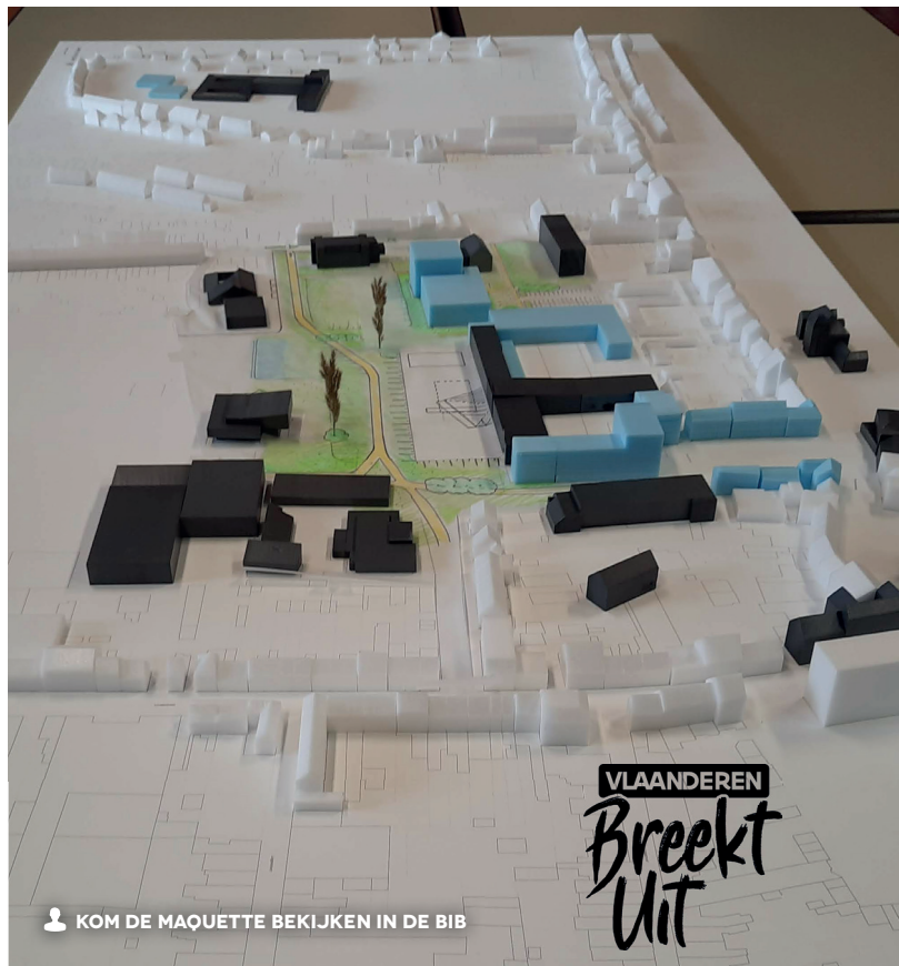
KOM DE MAQUETTE BEKIJKEN IN DE BIB