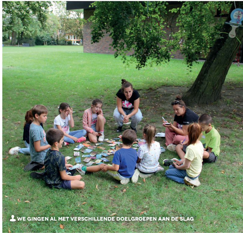
WE GINGEN AL MET VERSCHILLENDE DOELGROEPEN AAN DE SLAG

Zelf ontharden? Tegels en asfalt eruit, groen erin. We kiezen vaak voor tegels en asfalt omdat die onderhoudsvriendelijk lijken. Maar ongebruikte opritten of terrassen vergen toch een pak onderhoud: er kruipt veel tijd in vegen, vlekken verwijderen, onkruid verdelgen, ... Onderhoudsarme grasbetontegels of dergelijke besparen je meer tijd en zijn beter voor het klimaat.