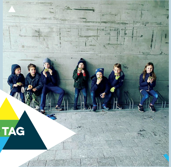
Flinke stappers... die verdienen al eens een donut op een velorek #igwevelgem #degroteletterkoekzoektocht