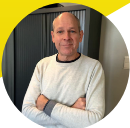
HOOFDINSPECTEUR POLITIEZONE GRENSELEIE MATTY DEJONGHE

In oktober was er de Week van de Handhaving. Een actieweek waarbij extra aandacht werd besteed aan sluikstorten en zwerfvuil. Dit jaar lag de focus vooral op sensibilisering. Een 30-tal medewerkers van de gemeente en politie spraken een 130-tal automobilisten en een 250-tal scholieren, fietsers en wandelaars aan. Er gebeurden ook extra politiecontroles met gebruik van extra camera's.