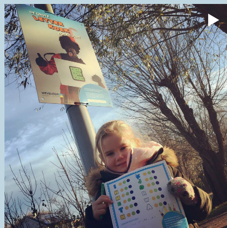
De grote letter-koekzoektocht! Alles gevonden en de brief op de post gedaan.

BRENG ONZE GEMEENTE IN BEELD. Plaats je foto's op Instagram en Facebook met hashtag #IGWEVELGEM . Wie weet haalt jouw foto onze fotomuur!