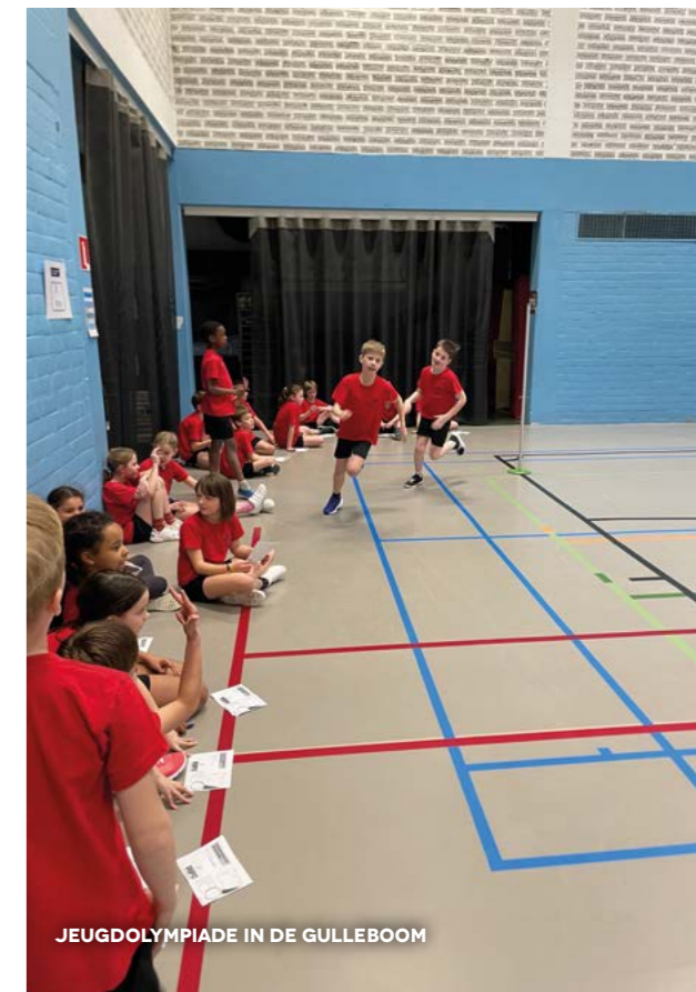
JEUGDOLYMPIADE IN DE GULLEBOOM