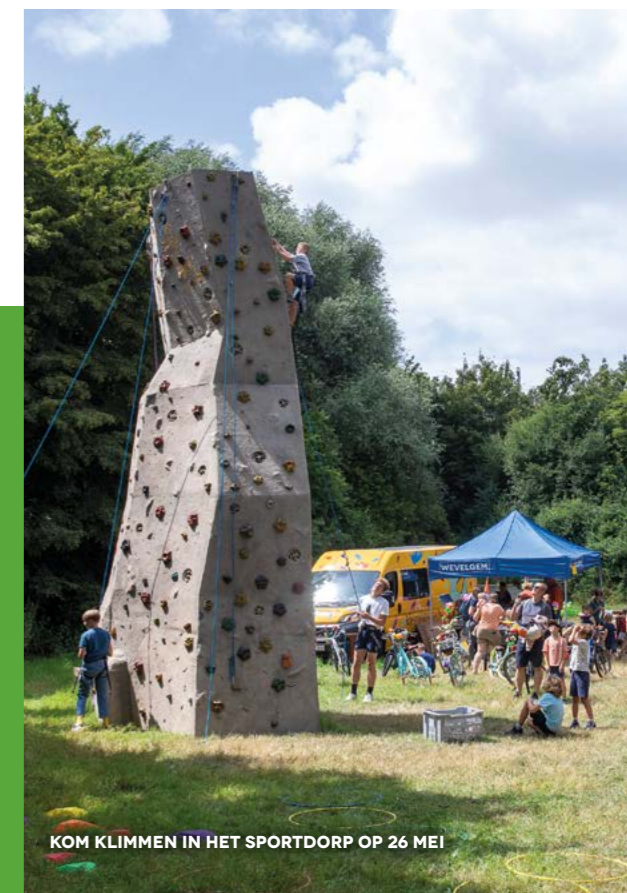
KOM KLIMMEN IN HET SPORTDORP OP 26 MEI