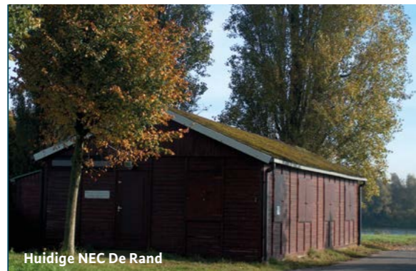
Huidige NEC De Rand