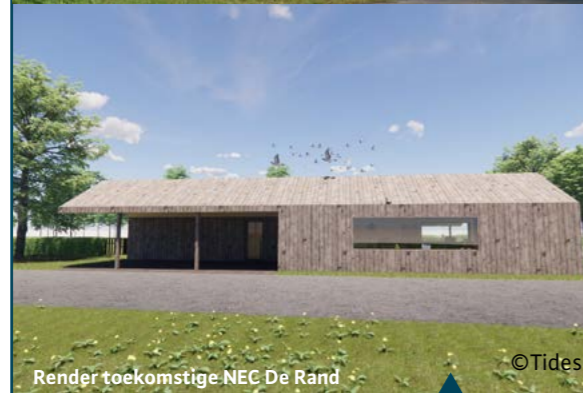
Render toekomstige NEC De Rand